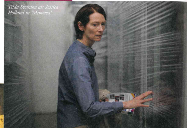
Tilda Swinton als Jessica Holland in 'Memoria'